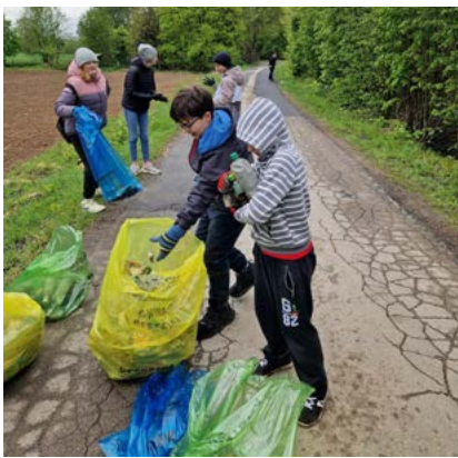
Zbieranie śmieci wzdłuż ulic gminy

Nie bez odzewu ze strony mieszkańców przebiegał w gminie Bestwina tegoroczny Międzynarodowy Dzień Ziemi . Ta międzynarodowa inicjatywa zapoczątkowana w 1970 r. jest corocznie obchodzona 22 kwietnia. Włącza się w nią młodzież, politycy i samorządowcy, grupy i stowarzyszenia. Mimo padającego deszczu i niskiej temperatury przedszkolaki, uczniowie i pracownicy placówek oświatowych w naszych sołectwach pracowicie sprząkali pobocza dróg, rowy, zagajniki, lasy itd., ucząc się przy okazji prawidłowej segregacji odpadów. W akcji brali udział radni, sołtysi, a także Straże Pożarne czy Koła Gospodyń Wiejskich,