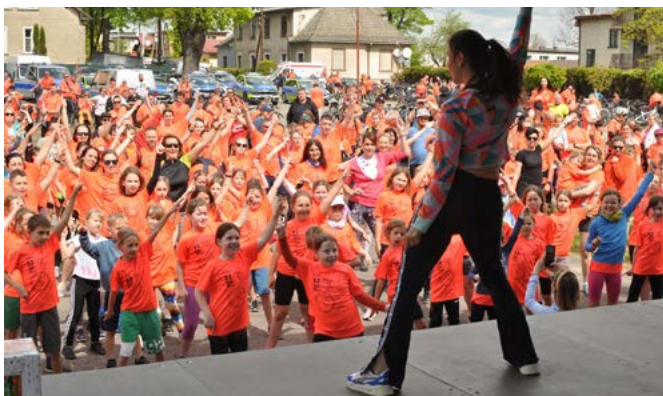
Konkurencja taneczna „W rytmie Zumby”