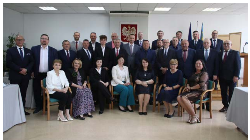
Nowa Rada Powiatu Bielskiego