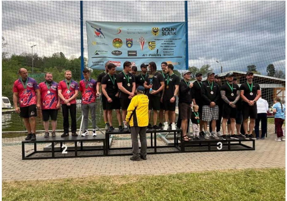
Kajakpolicie na podium w Leśnej