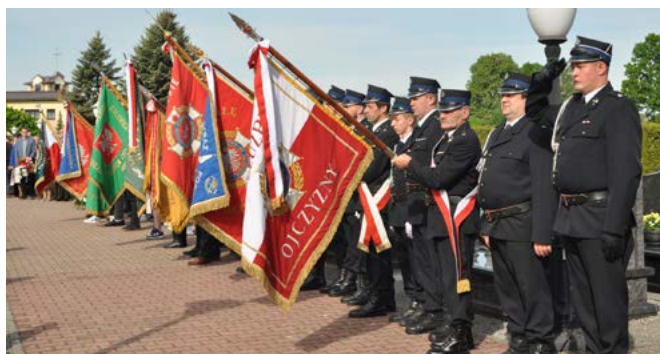
Poczty sztandarowe obecne na uroczystości