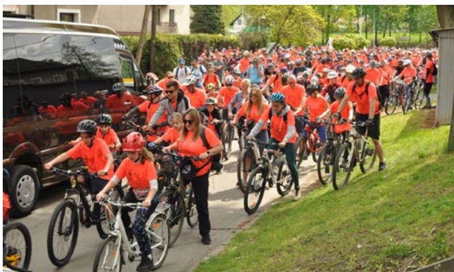
W rajdzie uczestniczyło ok. 2 tys. rowerzystów