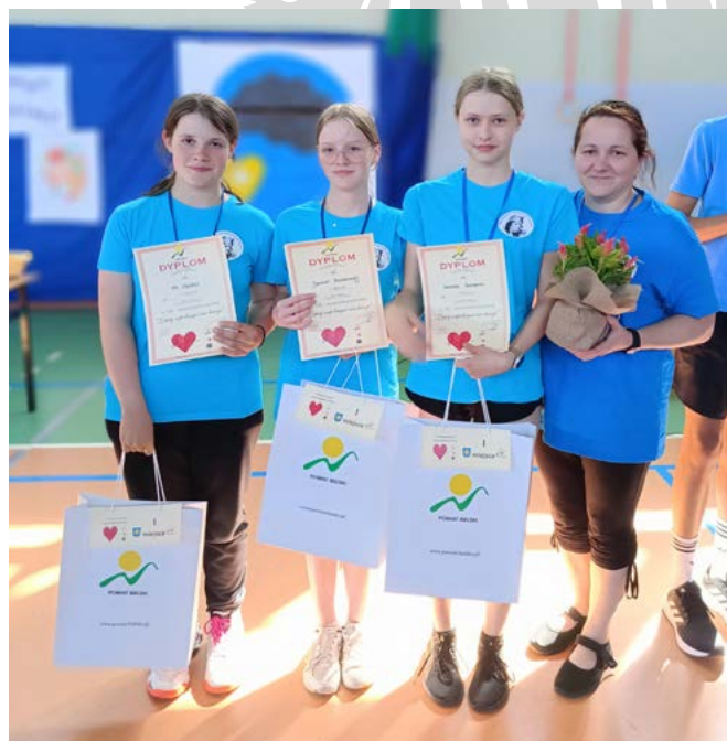
Drużyna SP Kaniów – zwyciężcy etapu powiatowego

III miejsce – drużyna ze Szkoły Podstawowej im. Bolesława Chrobrego w Rybarzowicach.