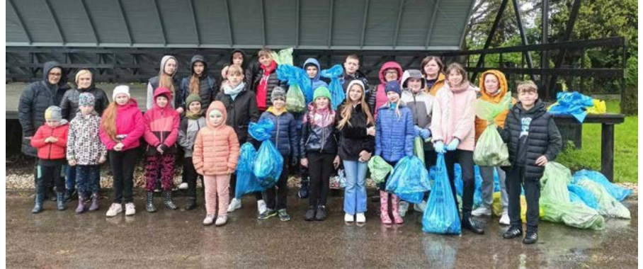
Na terenach rekreacyjnych w Kaniowie