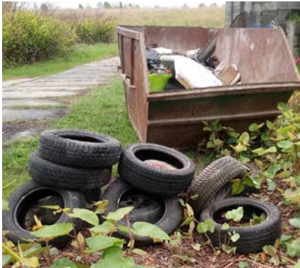
Odpady wyłowione z Wisły