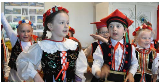
Występy przedszkolaków – tańce krakowskie