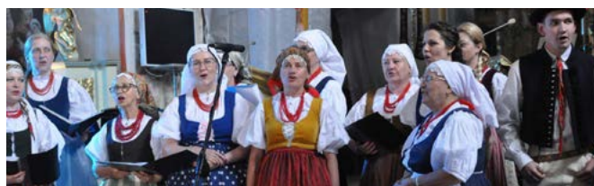
Regionalny Zespół Pieśni i Tańca „Bestwina”

W repertuarze zespołu Dynamika oraz Regionalnego Zespołu Pieśni i Tańca Bestwina znalazły się pieśni i piosenki, stare i nowe, polskie i zagraniczne. W starych murach bestwińskiego kościoła wybrzmiały one niezwykle pięknie. Koncert będzie pamiętany jeszcze bardzo długo.