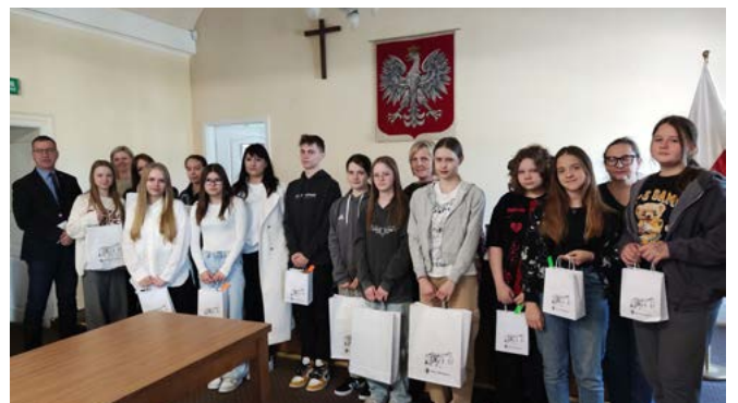
Etap gminny – uczestnicy z placówek oświatowych