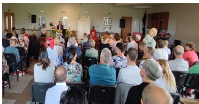
Uroczystości jubileuszowe – Msza św.