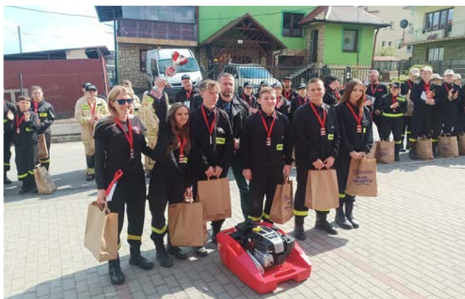
Drużyna MDP OSP Bestwina

Za strażackie przygotowanie drużyna została wyróżniona przy zadaniu związanym z zadymieniem w kotłowni. Za pierwsze miejsce otrzymano puchary oraz pompę pływającą Niagara, która doposaży samochód GCBA Kerax, włączony niedawno do podziału bojowego OSP Bestwina.