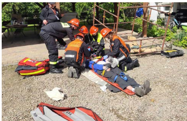
Jedna z konkurencji na zawodach