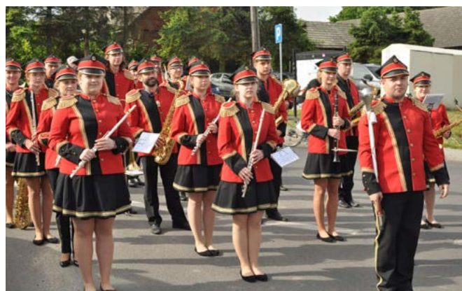
Obchody uświetniła Orkiestra Dęta Gminy Bestwina z siedzibą w Kaniowie