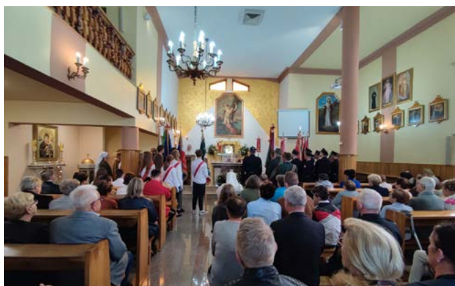
Msza św. w kościele św. Sebastiana w Bestwince

Rok 2024 dostarcza mieszkańcom gminy Bestwina nieustannych powodów do świętowania – obok celebrowanej w maju 233 rocznicy uchwalenia Ustawy Rządowej z 1791 r. obchodzimy 20-lecie obecności Polski w Unii Europejskiej, 25-lecie powiatu bielskiego, jubileusze klubów sportowych czy innych stowarzyszeń, nie zapominamy również o druhach Ochotniczej Straży Pożarnej w dniu św. Floriana. Także niedawne wybory samorządowe zwykło się w mediach nazywać „świętem demokracji”. Wszystkie te wydarzenia integrują naszą wspólnotę lokalną, pozwalają poczuć się częścią większych społeczności, a nade wszystko – zmanifestować polskość. Rosnąca z roku na rok liczba biało-czerwonych flag przy domach to potwierdzenie powyższych wniosków. Poza tym cieszy nasza gotowość do angażowania się w cenne inicjatywy społeczne takie jak np. Międzynarodowy Dzień Ziemi.