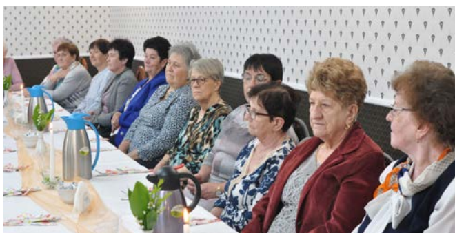
Gospodynie z Bestwinki przy wspólnym stole